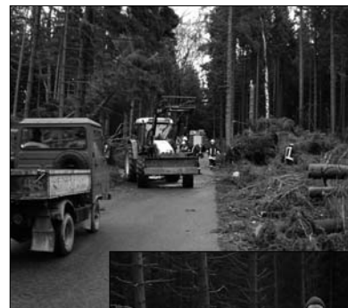
Unser Bergwald nach dem Orkan „Kyrill“ vom 18.01.2008

Wir konnten zahlreiche Gäste begrüßen, worüber wir uns riesig gefreut haben. Zeigt es uns doch, dass Sie unsere Arbeit anerkennen. 2008 können wir im 1. Quartal bereits von 8 Einsätzen mit 116 Einsatzstunden berichten. Beim Optimal-Getränkemarkt wurde ein Löschwasserbehälter mit 30.000 Litern eingebaut. Da wir in Scheibenberg das Hydrantennetz nur begrenzt nutzen können, sind wir auf solche Löschwasserbehälter angewiesen.