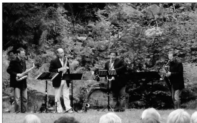
Kultursommerkonzert am 07.09.2008 an den Scheibenberger Orgelpfeifen.