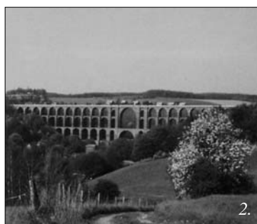
1. 21 Meter hoher Aussichtsturm auf dem 510m hohen Kuhberg im nordöstlichen Vogtland. 2. Die Göltzschtalbrücke, die größte Ziegelbrücke der Welt.