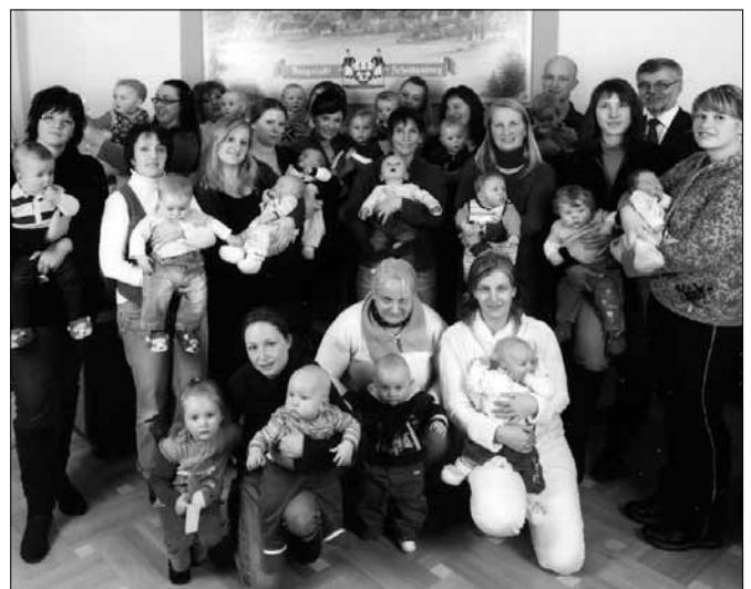
Begrüßung der 19 Neugeborenen 2010 in der Stadt Scheibenberg.