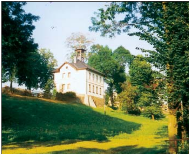
Unsere alte Dorfschule mit Glockenturm

Uns Oberscheibener Bürger beschäftigt zur Zeit auch unsere alte Dorfschule, die grundhaft saniert wird. Welche Schwierigkeiten dabei auftraten, konnte keiner zuvor ahnen.