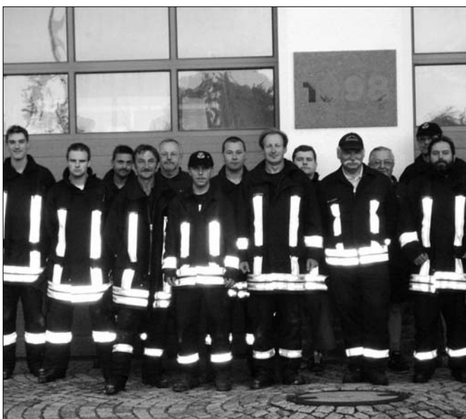
Die Freiwillige Feuerwehr Scheibenberg