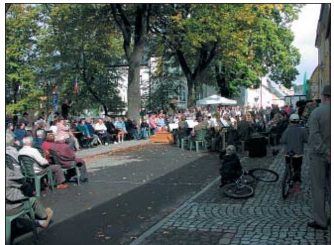
Freundschaft über Grenzen hinweg