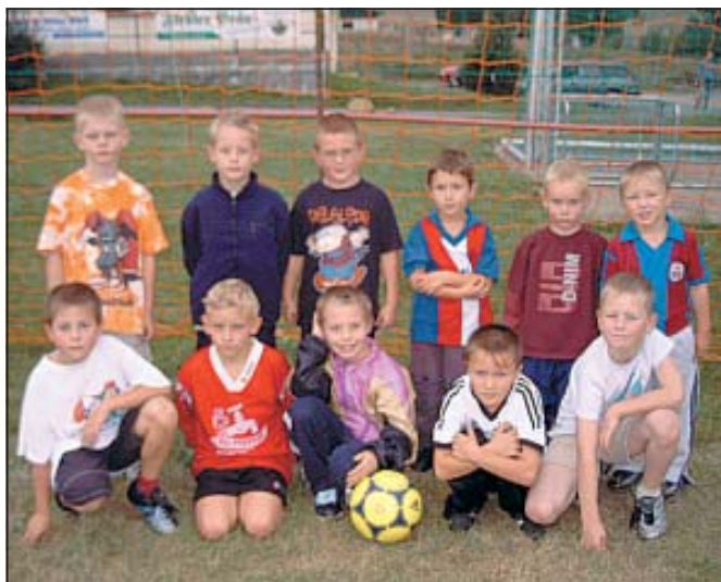
Nach dem Training am 08.09.03

Gleichfalls möchten wir in loser Folge unsere Übungsgruppen bzw. Mannschaften präsentieren. Beginnen werden wir mit der Bambini-Gruppe: