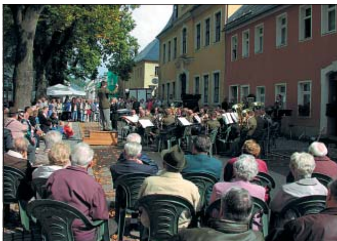
Konzert des Militärblasorchesters Karlovy Vary am 14. September 2003 auf dem Marktplatz

In unserer Stadt sind jetzt zum Herbstanfang die Bauvorhaben gut vorangekommen. Besonders froh sind wir darüber, dass die