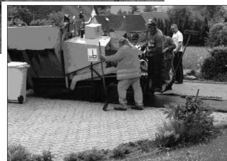
Sanierung der Eigenheimstraße