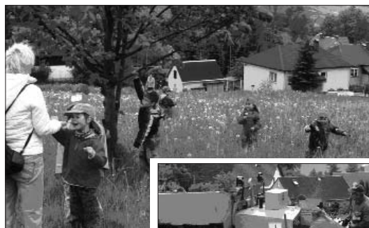
Kindergarten- gruppe in Ober- scheibe

Donnerstag, den 11.12., 19.00 Uhr im Dorfgemeinschaftshaus in Oberscheibe.